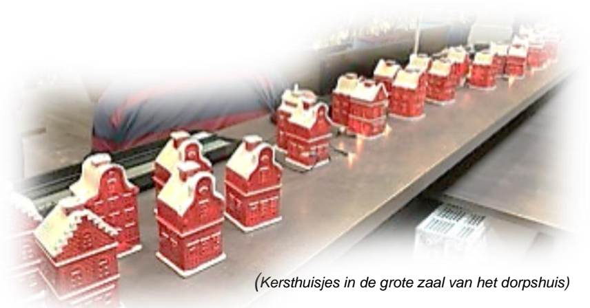
(Kersthuisjes in de grote zaal van het dorpshuis)

Ons dorp verdriedubbelt. Gemeente, ontwikkelaars en woordvoerders van Lisserbroek werken inmiddels ruim acht jaar aan plannen om in en om het bestaande dorp 4000 huizen te bouwen. In onze dorpsgemeenschap leven vele ideeën, die zijn ingebracht in een nieuwe vorm van dorpsraadpleging.